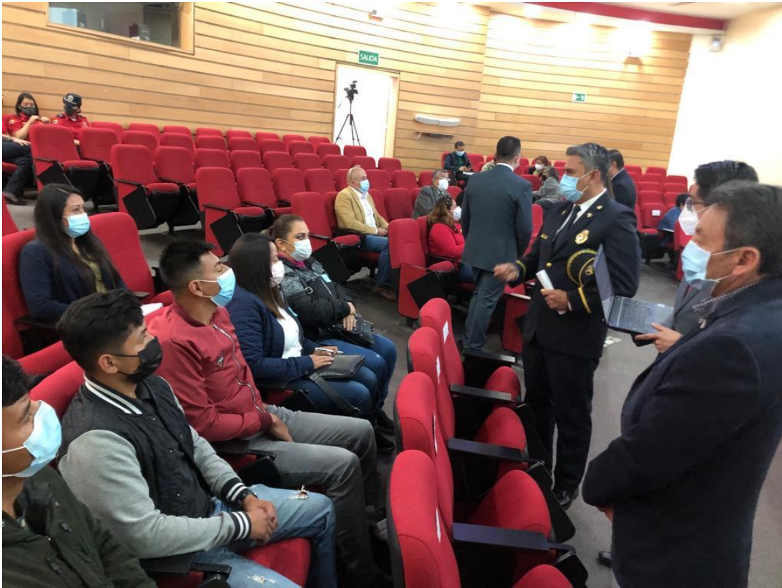
RENDICIÓN DE CUENTAS 2021 Auditorio del Cuerpo de Bomberos del DMQ – 22 de abril de 2022