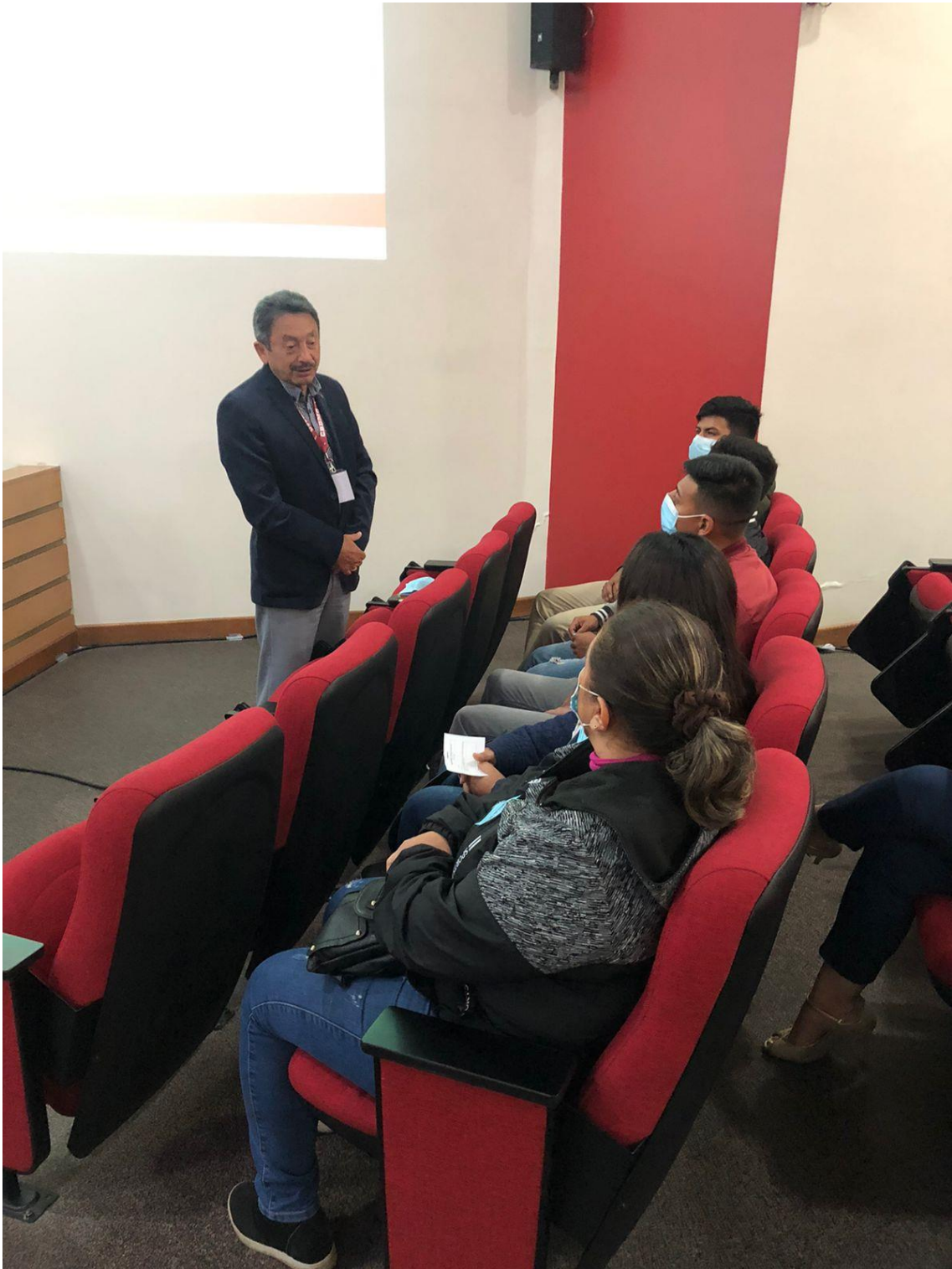
RENDICIÓN DE CUENTAS 2021 Auditorio del Cuerpo de Bomberos del DMQ – 22 de abril de 2022