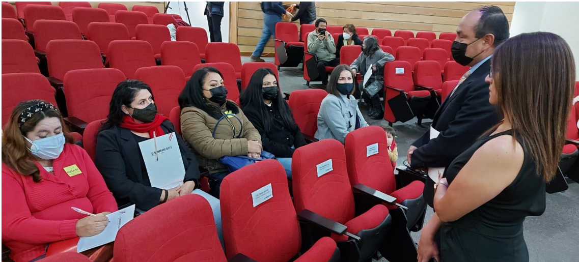
RENDICIÓN DE CUENTAS 2021 Auditorio del Cuerpo de Bomberos del DMQ – 22 de abril de 2022