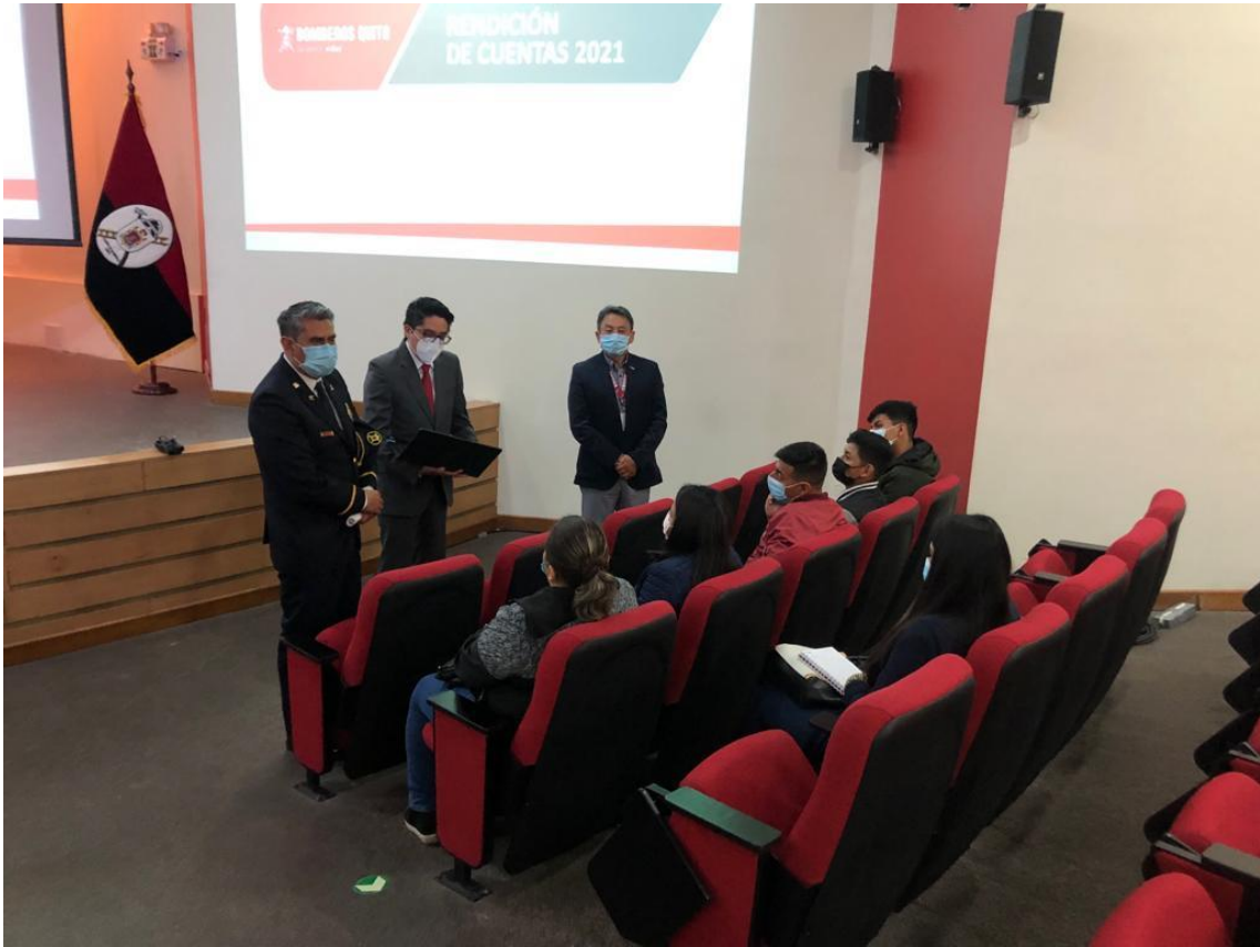
RENDICIÓN DE CUENTAS 2021 Auditorio del Cuerpo de Bomberos del DMQ – 22 de abril de 2022