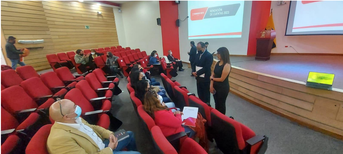
RENDICIÓN DE CUENTAS 2021 Auditorio del Cuerpo de Bomberos del DMQ – 22 de abril de 2022